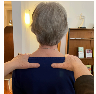
GEISTIGE AUFRICHTUNG DEINER WIRBELSÄULE - VORHER & NACHHER